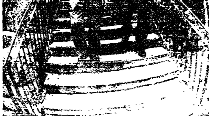
بعد انتهاء اللقاء

المسيحي خائف والمسلم مغبون سلام: متفقون على بقاء لبنان الواحد والجميل: قلنا مفتوح للحوار وماخذنا على الشيوعية